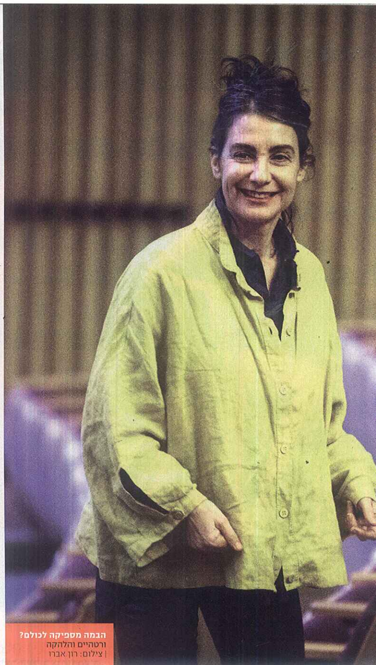
הבמה מספיקה לכולם? ורטהיים והלהקה

להקת המחול של יסמין גודר עובדת כבר שלוש שנים עם חולי פרקינסון, ואתם מוזמנים לכנס הכולל סדנאות חווייתיות, מופעים פתוחים והרצאות אורח. ← מרכז תרבות ע"ש ג'ק ג'וזף ומורטון מנדל, התחייה 2 יפו, חמישי (18.1) 19:10, כניסה חופשית